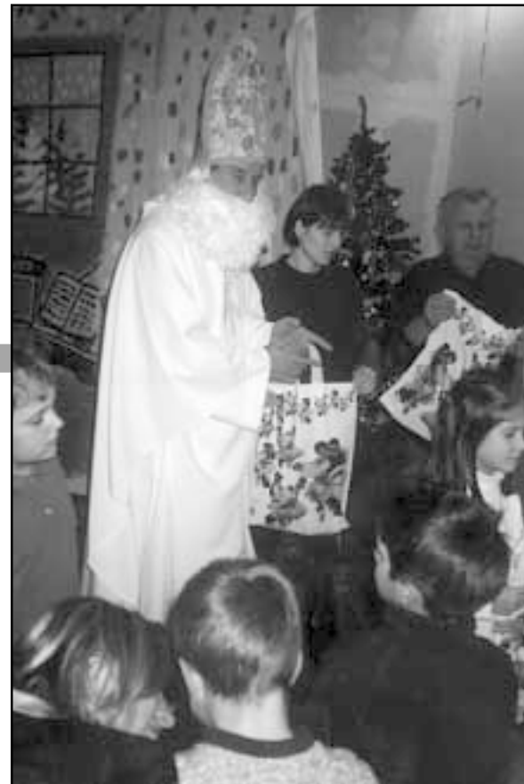
Sv. Nikola u razgovoru s djecom