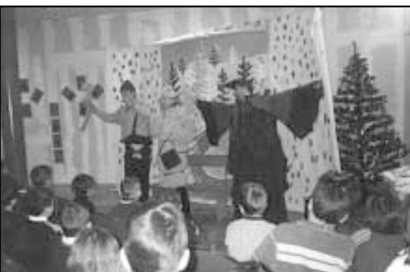
Predstava »Bajka o božićnom drvcu«