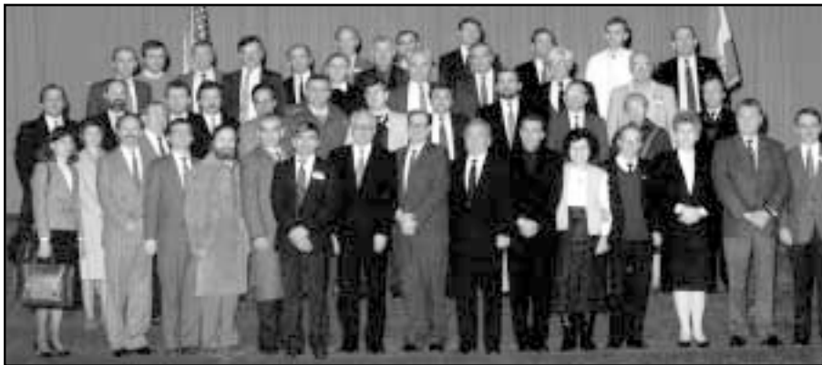
Na prvog konvenciji HDZ-a u Clevelandu 20. i 21. siječnja 1990.

Sljedećeg ljeta (u lipnju i srpnju 1988.) uslijedio je drugi posjet dr. Tuđmana hrvatskom iseljeništvu na sjevernoameričkom kontinentu, ali sa znatno sadržajnijim programom boravka koji je obuhvaćao i veći broj mjesta, i SAD i Kanadu. Predavanja dr. Tuđmana, u organizaciji uglednih hrvatskih domoljuba, na američkim sveučilištima tom su prigodom bila inspirira-