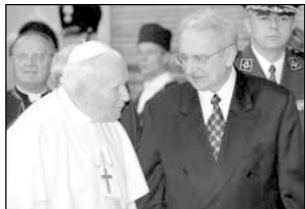
Sa Svetim Ocem prošle godine u Zagrebu

Hrvatsko je iseljeničtvo voljelo dr. Franjo Tuđmana. Hrvatsko mu je iseljeničtvo vjerovalo. Temelji hrvatske države koje je stvorio sjedinjujući domovinu i dijasporu, temelji su na kojima će budući hrvatski naraštaji graditi svoju zemlju