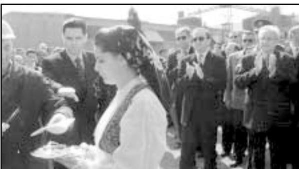
Srdačan doček u Mostaru

Potresno je bilo i na komemoraciji na kojoj su bili nazočni svi hrvatski dužnosnici u BiH. Nakon tužne sjednice prisjećali su se svih Tuđmanovih dolazaka u Bosnu i Hercegovinu. Otkako je izabran za predsjednika Republike Hrvatske, Tuđman je devet puta boravio u toj državi. Prvi put u Sarajevu 1991. godine kada je održan zajednički sastanak svih predsjednika republika nastalih raspadom bivše Jugoslavije. Potom je 1993. godine dr. Tuđman doputovao u Međugorje gdje je u bazi SFOR-a sa stranim diplomatima tražio mirovna rješenja. Za tog posjeta obišao je još Široki Brijeg (otvorio obnovljenu gimnaziju), Ljubuški, Grude, Posušje, Tomislavgrad i Livno. Deseci tisuća građana organizirali su nezaboravan doček čovjeku kojeg su voljeli. Treći boravak u BiH započeo je u Sarajevu, gdje je dr. Tuđman otvorio hrvatsko veleposlanstvo. Iz Sa-