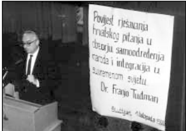
S Hrvatima u Stuttgartu 1988. godine