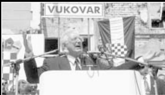
Posjet Vukovaru nakon mirne reintegracije

man je iznimno teške mandate u kojima je stvorena i obranjena hrvatska država te započeo proces njezine obnove i izgradnje. Sve je to postigao oslanjajući se samo na snage hrvatskoga čovjeka, i onoga u domovini, i onoga u iseljeništvu