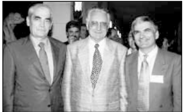
S prijateljima povratnicima iz iseljeništvu 1996. na Saboru HSK-a na Brijunima

Bilo je to vrijeme kada su demokratski pokreti poprilično uzimali maha u istočnoeuropskim komunističkim zemljama i kada su se u Jugoslaviji već osjećali zahtjevi za demokratskim promjenama, ali i vrijeme uspona Slobodana Miloševića (8. svibnja 1989. izabran za predsjednika Centralnoga komiteta Saveza komunista Srbije) na jugoslavensku političku scenu i velikosrpskih nastojanja u ostvarivanju projekta Velike Srbije iz Memoranduma Srpske akademije nauka (iz 1986. godine). Srpski su komunisti u to vrijeme, zajedno sa Srpskom pravoslavnom crkvom, održali proslavu 600. godišnjice Kosovske bitke na Gazi-