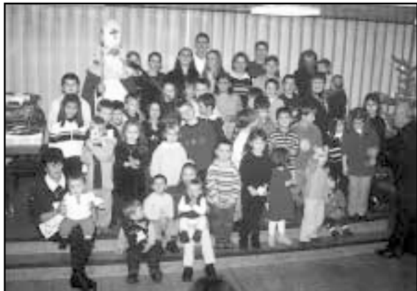
Djeca sa sv. Nikolom

U PROSTORIJAMA HMI-a PROSLAVLJEN BLAGDAN Sv. NIKOLE