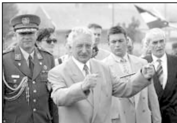
U Kninu nakon pobjedonosne akcije »Oluja«