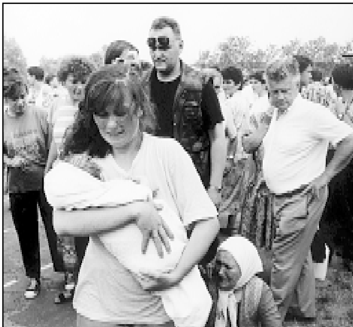
Iako je nasilje koje su srpski agresori proveli u Bosanskoj Posavini bilo krajnje brutalno većina Posavljaka se želi vratiti

Prostor osam posavskih općina, većinski nastanjen Hrvatima, gotovo u cijelosti okupiran je 1992. i na njemu učvršćena zločinačka vlast. Od ukupno 369,5 tisuća stanovnika, Hrvata je bilo 136.120 ili 37 posto, Bošnjaka 104.420 ili 28 posto, 99.970 Srba ili 27 posto i 29.000 ostalih ili 8 posto. Samo područje Broda i Dervente među prvima je izloženo srpskim napadima u BiH. Početkom ožujka 1992., od-