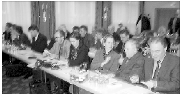
S godišnje skupštine hrvatskih ugostitelja u Koelnu