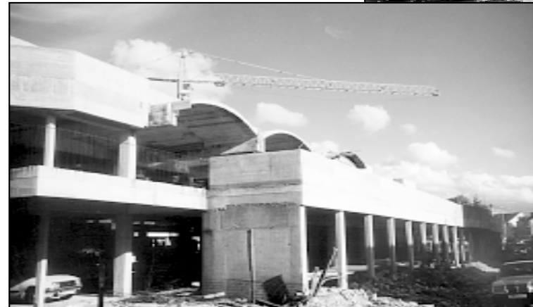
Što nakon rada u inozemstvu - odmor ili poduzetništvo? Gradnja poslovnog centra u Imotskom (na slici), kojeg gradi povratnik Ivan Smoljko

zvojni obrtništva istaknuta je potreba promjene poreznog sustava, rješavanje nelikvidnosti i nezaposlenosti kao i za poticanje izvoza te stranih ulaganja. poduzetnički san? Srećom, poduzetništvo niti počinje niti završava s nekom vlašću. Da je tome tako govore i činjenice: u Francuskoj mala poduzeća čine čak 99 posto svih tvrtki u zemlji, u Austriji, Belgiji i Nizozemskoj 98 posto, u Švicarskoj 97 posto, u SAD-u oko 90 posto. Budući su to zemlje iz kojih većinom dolaze naši povratnici, pitanje je što ih čeka u Hrvatskoj? Hrvatska već nekoliko godina preko Ministarstva gospodarstva, na čije je čelo upravo zasjelo uspješni hrvatski poduzetnik Goranko Fizić, nudi niz konkretnih programa i podršku. I doista, povratnici poduzetnici su u Hrvatskoj nemaju puno osjećati se izgubljenima. Redom: 1997. i 1998. godine naglašak je bio na poticanju financijskim sredstvima jedinicama lokalne samouprave za