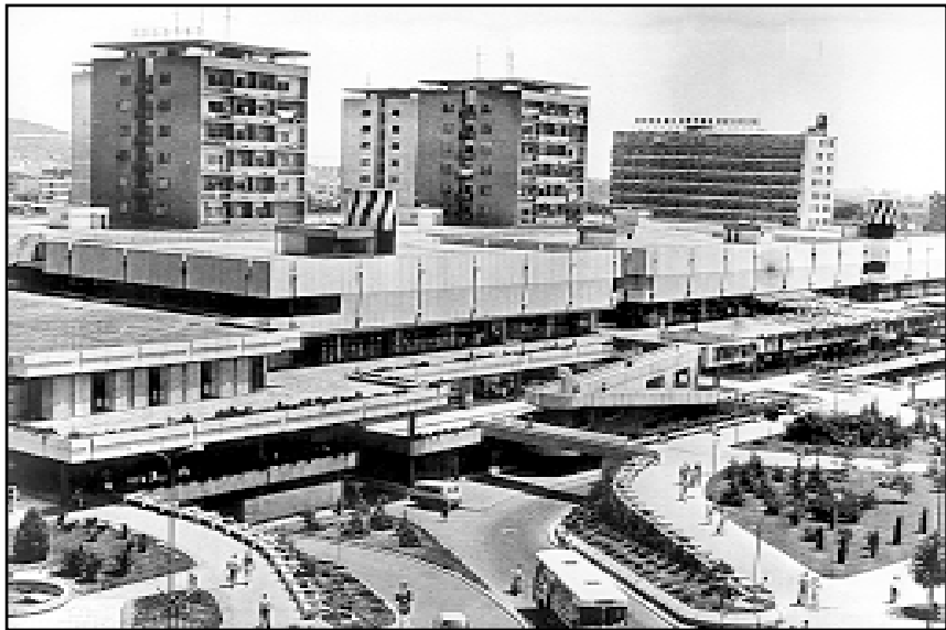
U Skopju i u cijeloj Makedoniji je mnogo više Hrvata nego što pokazuju statistike