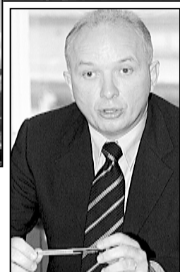
Goranko Fizić, novi čelni čovjek Ministarstva gospodarstva - osnovnog inicijatora malopoduzetničke pomoći

propisuju znatno blaže uvjete. Osim garancije, HGA dodjeljuje poduzetnicima i bespovratnu financijsku potporu: direktno plaća registraciju obrta, kreditno umjesto poduzetnika prve rade otplate kredita, za poduzetnike početnike snosi 50 posto troška konzultantske usluge. Kreću li banke s poticajima? Za poduzetnike koji uspije-