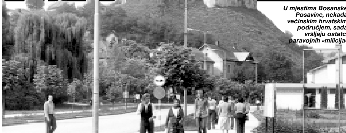
U mjestima Bosanske Posavine, nekada većinskim hrvatskim područjem, sada vršljaju ostatci paravojsnih »milicija«

ZAGREB/FRANKFURT, 21. veljače 2000. - BROJ 284 • www.hic.hr/dom •