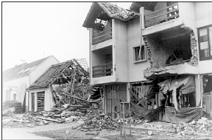
Međunarodna zajednica će morati mnogo uložiti u obnovu kuća

U Johovcu (1340 Hrvata), najužnijem plehanskom selu, stvoren je odbor za povratak koji je anketirao izbjeglice i dobio potpise za više od polovice obitelji koji se žele vratiti u