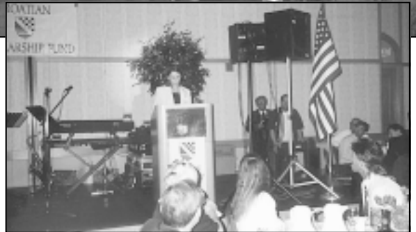
Svećane večere za stipendiste održavaju se svake godine