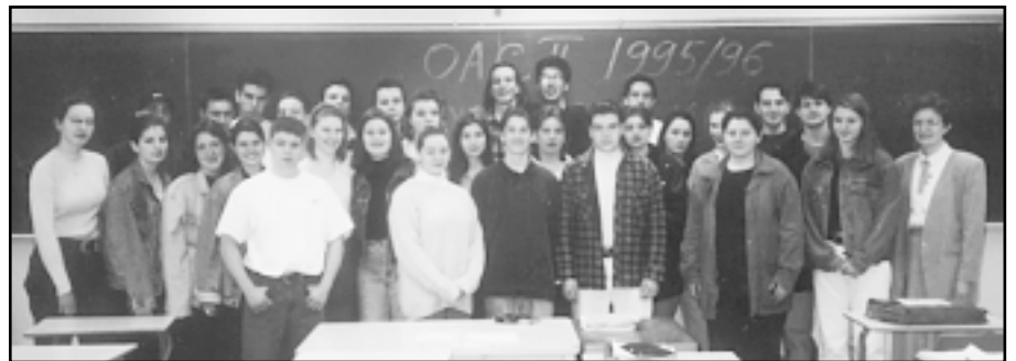
Profesorica sa svojim 13. razredom Hrvatske škole u Torontu

POMOĆNICA MINISTRA VANJSKIH POSLOVA VESNA CVJETKOVIĆ-KURELEC: