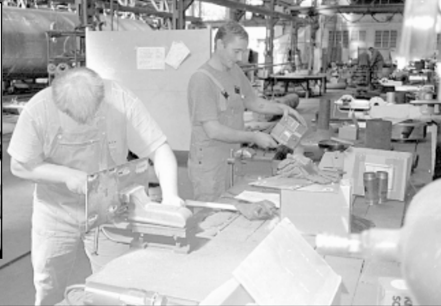
U privredi treba ostaviti novac

nopolizacije i etatizacije nad tržišnim gospodarstvom, a potvrđeno je kroz povijest da je država uvijek najgori poduzetnik. Tako nadzirano tržište uz visoka porezna opterećenja samo po sebi je najbolji put u recesiju. Nova vlada se tako našla u nezavidnoj situaciji. S jedne strane, dužna je izvršiti predizborna obećanja i dogovore sa sindikatima, koje je potpisala još bivša vlada, o povećanju plaća u javnom sektoru ove godine za dvanaest posto, a s druge, trošenje kapitalnih prihoda za tekuću potrošnju na dulji rok bi je umjesto kreatora politike razvoja mogla pretvoriti u stečajnog upravitelja. Nije dobro živjeti iznad stvarnih mogućnosti.