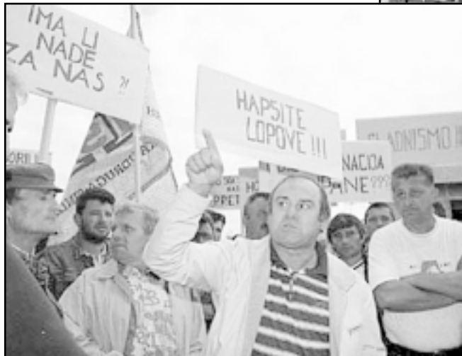
Vlada će pokušati izbjeći ovakve prizore