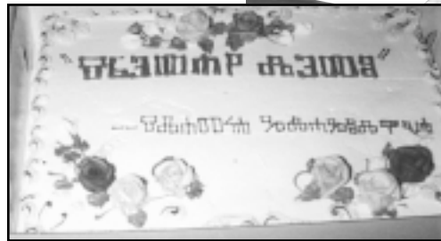
Studenti glagoljske paleografije u Pittsburgu naručili su »glagoljsku« tortu