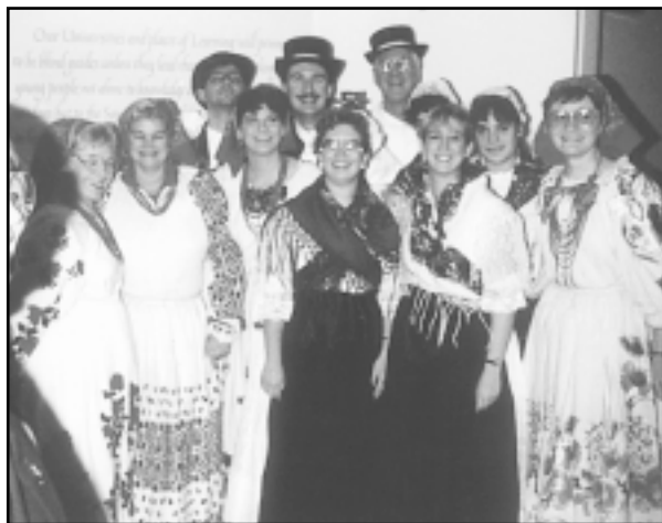
Studenti hrvatskoga jezika u Pittsburgu zajedno sa svojom profesoricom

Osim stručnoga rada, dr. Čunčić mnogo je radila i na duhovnoj obnovi mladih, pa je tako na poziv Hrvatskoga centra u Norvalu, Ontario, Kanada, došla k njima i s mladima radila od 1988. do 1991. godine. U periodu kada se trebalo izboriti za priznanje Hrvatske dr. Čunčić se ustrajno bori i sudjeluje na mnogobrojnim predavanjima