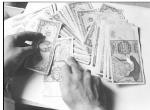
Ostat će čvrst tečaj kune

Problem i jest u tome da je Hrvatska prisiljena kapitalne prihode upotrijebiti za tekuću potrošnju, što je najveća strukturalna boljka naše ekonomije. Ovakav postotak udjela javne potrošnje (šezdeset posto) ne bi izdržala ni mnogo jača i zdravija gospodarstva