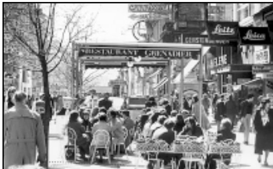
Austrijanci su zabrinutiji za radna mjesta nego za sankcije EU-a

I dok na jednoj strani Hrvatska postaje miljenicom europskih političara, na dru-