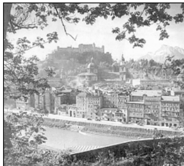
Zahvaljujući HKM-u, Hrvati u Salzburgu imaju bogat društveni život

U subotu 29. travnja održat će se svečana akademija u župnom centru Taxham u Salzburgu. U akademiji će sudjelovati domaći folkloristi, vjerončenici i djeca iz hrvatske dopunske nastave. Svoj dolazak najavili su i franjevački bogoslovi iz Sarajeva koji nastupaju u sastavu »Jukić«. U nedjelju 30. travnja održat će se svečana misa u crkvi St. Andra na Mirabellplatzu u Salzburgu s početkom u 12 sati. Misno slavlje predvodit će, kako se očekuje, msgr. Ilija Janjić, ko-