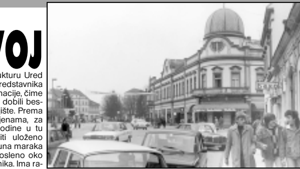
Brčko je postalo paradigma srednjih odnosa u budućnosti u cijeloj BiH