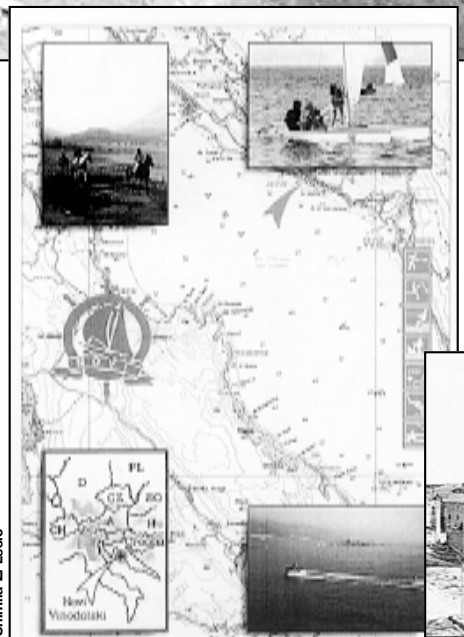
Upoznajmo Lijepu našu

Odjel za hrvatske manjine organizirat će stručne ekscurzije učenika manjinskih hrvatskih škola, a u pripremi je tradicionalna Smotra hrvatskih kulturno-umjetničkih društava iz europskih zemalja te Tjedan kulture hrvatskih autohtonih manjina. Također HMI organizira, i ove godine, ljetni obnoviteljski program Task Force 2000