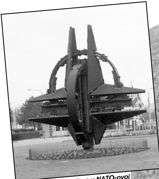
Nekolicina geopolitičara u NATO-ovoj snazi vide sredstvo za nametanje štetnih trendova globalizacije