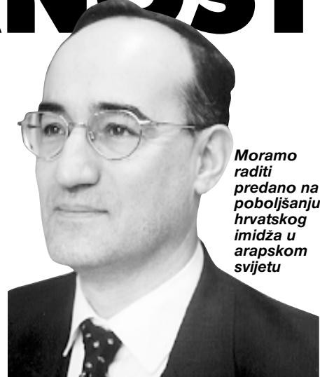
Moramo raditi predano na poboljšanju hrvatskog imidža u arapskom svijetu

-Nije na meni govoriti o mojim nazovi uspjesima. Sve što sam učinio na jačanju istine i pravde uspjeh je moj i moje domovine. Vjerujem da sam navodeći ljude s kojima sam surađivao na dobrobit RH ukazao na narav onoga što zovete uspjehom. Sjećam se 20. rujna 1991. godine kada sam proveo gotovo cijeli dan s gospođom Thatcher povodom srpskog slanja tenkova iz Beograda na Vukovar i kada je ona preda mno, nakon komentara svoga savjetnika da će je britanska Vlada pribiti na križ zbog svog nezavisnog angažmana u potpori Hrvatskoj, izgovorila svoju čuvenu rečenicu: »Ako je pitanje pribiti