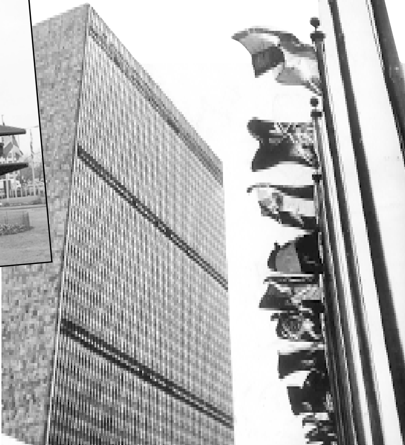
Jesu li UN preteča svjetske vlade

JE LI OPRAVDAN STRAH OD GLOBALIZACIJE KOJA JE POSLJEDICA BRZE INFORMATIZACIJE I CENTRALIZACIJE SVJETSKOG KAPITALA