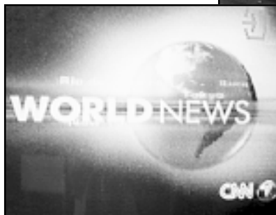
Masmediji i holivudska filmska produkcija već su napravili globalizaciju u kulturi