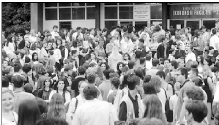
Ljetna upisna groznica

no-nastavnim područjima: prirodoslovno područje (Prirodoslovno-matematički fakultet); tehničko područje (Arhitektonski fakultet, Fakultet elektrotehnike i računarstva, Fakultet kemijskog inženjersva i tehnologije, Fakultet prometnih znanosti, Fakultet strojarstva i brodogradnje, Geodetski fakultet, Geotehnički fakultet Varaždin, Građevinski fakultet, Grafički fakultet, Matematički fakultet Sisak, Rudarsko-geološko-naftni fakultet, Tekstilno-tehnološki fakultet, Viša tehnička škola, Studij poslovne informatike); biomedicinsko područje (Farmaceutsko biokemijski fakultet, Medicinski fakultet, Veterinarski fakultet); biotehničko područje (Agronomski fakultet, Prehrambeno-biotehnički fakultet, Šumarski fakultet, Poljoprivredni institut, Križevci); društveno-humanističko-teološko područje (Ekonomski fakultet, Fakultet organizacije i informatike Varaždin, Fakultet za političkih znanosti, Fakultet za