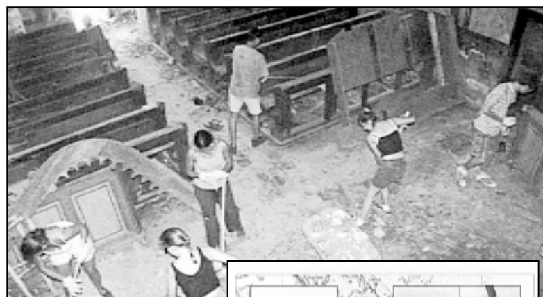
U brošuri je opisani Task Force 2000., program kojim se iseljenička mladež uključuje u obnovu domovine

Hrvatska matica iseljenika priređuje 8 ljetnih obrazovnih programa dvotjednog trajanja u kojima će vrtni hrvatski stručnjaci prenositi djeci i mladeži iz hrvatskoga iseljeničtva temeljna znanja o hrvatskome jeziku, kulturi i običajima. Djeca i mladež iz hrvatske dijaspore tako će cijele godine, a osobito tijekom srpnja i kolovoza 2000. na izvoru