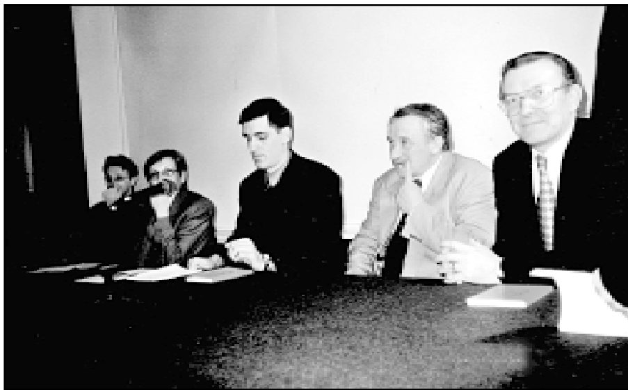
Promotori knjige »Etnografija Hrvata u Mađarskoj«

Osim istraživanja postojećih hrvatskih skupina, u »Etnografiji Hrvata u Mađarskoj 1999«, istražuju se i područja na kojima danas nema Hrvata. Uz to je važno napomenuti da se u nji-