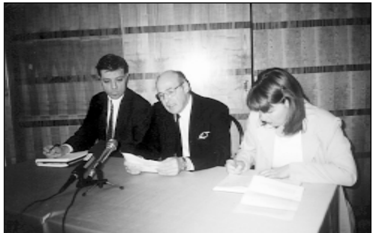
Izlaganje Franka Brozoviča, predsjednika CAA-a