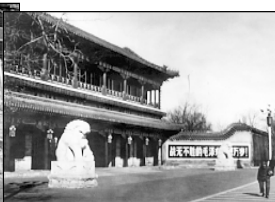
Većina geopolitičara misli da će jačanjem Kine biti spriječen proces svjetske amerikanizacije

Takva globalizacija, koju mnogi Europljani nazivaju i amerikanizacijom, mnogi misle ne odgovara malim državama, a pogotovo mladim kao što je naša, jer ona istodobno znači i denacionalizaciju nacionalne države. Kako su dometi globalizacije, bez obzira na to što su slični procesi poznati otkako je civilizacije, još uvijek nevidljivi mnogi teoretičari i izučavatelji globalizacije vide spas u renacionalizaciji nacionalne države. I u restrukturaciji društva. Jer neki dosezi nerazvijenih država i društava su želja razvijenih, osobito u području ekologije. To se danas osobito vidi u otporu