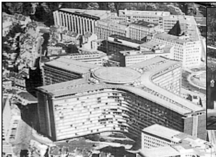
EU iako zamišljena u budućnosti kao politička zajednica još se ne može oduprijeti ni američkoj političkoj volji niti kapitalu

Možda je najpessimističnije to što ljudi postaju svjesni nestajanja svojeg nacionalnog identiteta tako što se ograničava suverenitet nacionalne države. Naravno, u smislu da države dragovoljno dio svog suvereniteta prepuštaju »svjetskoj državi«, onoj koja bi se trebala brinuti za opća ljudska dobra i prosperitet cjelokupne ljudske zajednice. To bi recimo bilo idealno zamišljena i