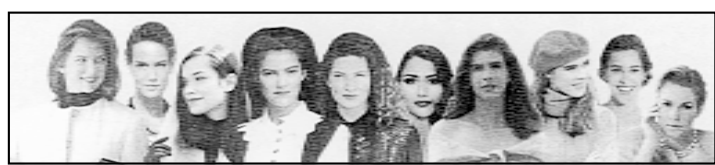
Predstavljene su i mladeške udruge

Hrvatska matica iseljenika organizira tradicionalni ljetni