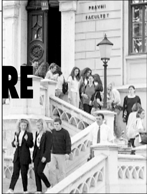
Brošura donosi obilje informacija o studiranju u Hrvatskoj

uz morskou obalu. Odjel za folklor Hrvatske matice iseljenika s posebnom je pozornošću priredio 4 sarđaja za ljubitelje hrvatske tradicijske kulture među kojima izdajemo tradicionalnu Školu hrvatskoga folkloru koja će se održati od 1. do 12. kolovoza 2000. Skupina hrvatskih probranih folklorista, etnologa i etnomuzikologa pod vodstvom dr. Ivana Ivančana predavat će, prema principima izvornosti i arhaičnosti, mladeži hrvatskoga podrijetla i njihovim prijateljima iz čitavog svijeta nacionalni folklor, glazbu i ples, i pokazati im izvorne kazivače i plesače iz pojedinih nacionalnih lokaliteta. Skoli folkloru redovito se priključuju stotine hrvatskih folklorista iz desetak zemalja sa svih kontinenata. Ovih se dana vrše posljednji dogovori za turneje hrvatskih folklornih grupa iz SAD-a i Australije te pripreme za Kanadsko hrvatski folklorni festival u Splitu.