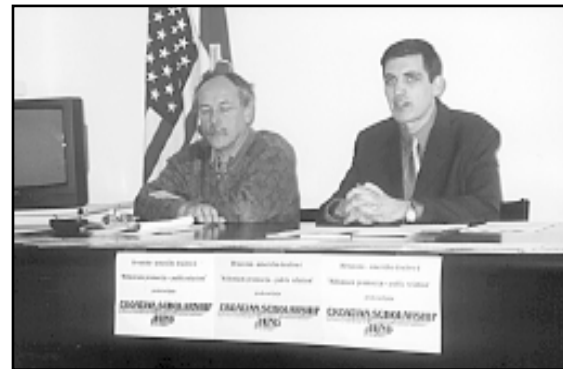
Konferenciju za novinare organizirala je Millenium promocija, koja je ujedno i zastupnik Zaklade u Hrvatskoj