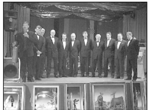
Nastup dalmatinske klapa »Feral« iz Frankfurta