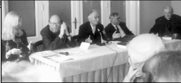
Susret u društvu hrvatskih književnika

Hrvatski klub iz Bratislave, koji okuplja Slovake koji se zanimaju za hrvatsku kulturu, obilježiti 550. obljetnicu rođenja Marka Marulića. Istog je dana upriličena Književna večer, na kojoj su gostovali pisci slovačkih književnih udruga. Sljedećeg dana je na Filozofskom fakultetu Sveučilišta u Zagre-