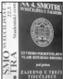
Vlada RH pozivala je buduće studente na Smotru Sveučilišta u Zagrebu pod geslom »Zajedno u treće tisućljeće«

U ZAGREBU OD 22. DO 24. OŽUJKA ODRŽANA ČETVRTA SMOTRA SVEUČILIŠTA POD NAZIVOM »ZAJEDNO U TREĆE TISUĆLJEĆE«