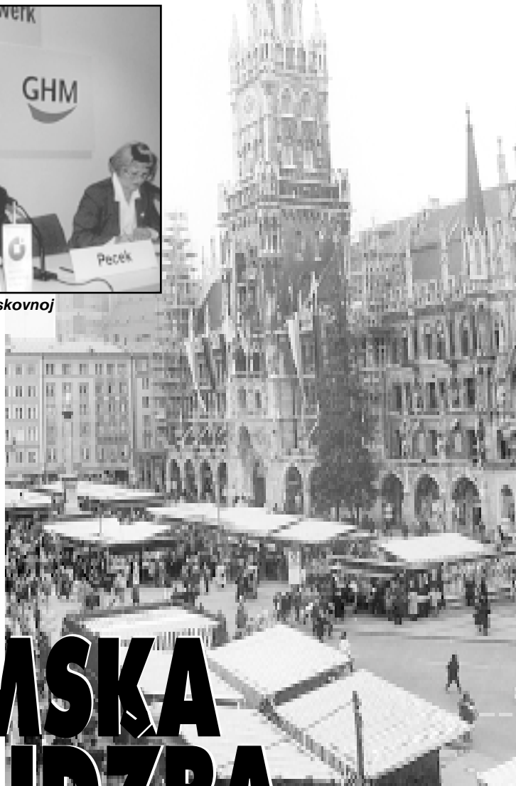
Muenchen zaradi 3,5 milijarde maraka na godinu od raznih sajmova

KAKO ZAHVALJUJUĆI MEĐUNARODNOM OBRtničKOM SAJMU U MUENCHENU NA KOJEM SE HRVATSKA NEDAVNO PREDSTAVILA HRVATSKI OBRtnICI VEĆ GODINAMA POVEĆAVAJU IZVOZ U NJEMAČKU