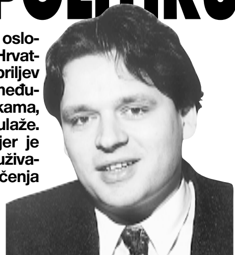
Novim Zakonom HNB je dobio velike ovlasti kojima se smanjuje mogućnost bankrota pojedinih banaka

»To je dosta teško reći i ja mogu izraziti samo svoje osobno mišljenje, a ono je da u ovom trenutku ne vidim novih kandidata za sanaciju. Podsjetit ću vas, posljednja banka koju je Vlada RH predložila za sanaciju bila je Croatia banka početkom 1999. godine, a prije toga je to bila Dubrovačka banka. Trenutno imamo dvije banke koje su sanirane i ponudile su svoje dionice na prodaju. To su Riječka banka, za koju se zna kupac, i Splitska banka, koja je u postupku privatizacije. Privatizacijom rukovodi Državna agencija za sanaciju banaka i osiguranje štednih uloga. I Riječka i Splitska banka sanirane su u razdoblju 1995. i 1996. godine, kada i Slavonska banka i Privredna banka, koje su već privatizirane: Slavonska banka prije više od godinu