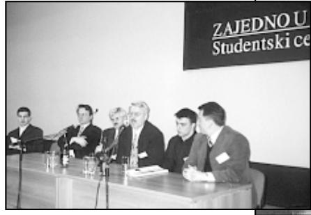
Organizatori Smotre Sveučilišta