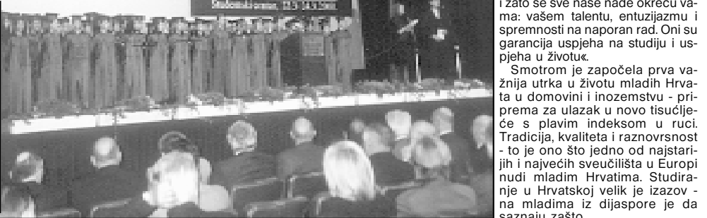
Otvaranje Četvrte smotre Sveučilišta u Zagrebu održano u Studentskom centru