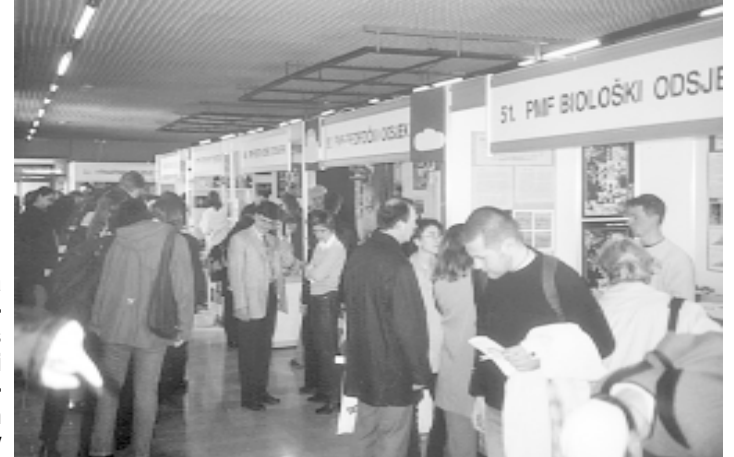
Uobičajena gužva oko štandova na Smotri govori o velikom interesu budućih brucea za studiranje u Zagrebu

S tradicijom dujom od 330 godina, jednom visokom školom i jednim sveučilišnim studijem. No, najveće bogatstvo Zagrebačkog sveučilišta je više od 63 000 studenata koji trenutno studiraju. Svi su oni prošli paniku, neizvjesnost i nesigurnost odabira studija i upisa na fakultet. Prosječni budući bruceo najvjerojatnije zna za medicinu, pravo i ekonomiju, no koja je razlika između geotehničkog i geodetskog fakulteta, gdje studirati odnosno s javnošću, a gdje socijalni rad - mnogim mladim Hrvatima, a pogotovo onima iz inozemstva zasigurno nije jasno. Pojavili su se novi studiji, postojeći se obogaćuju, no ono bitno svake je godine isto: za mlade iz dijaspore postoji posebna upisna kvota. Naime, ako prođu razredbeni prag, mogu se upisati na željeni