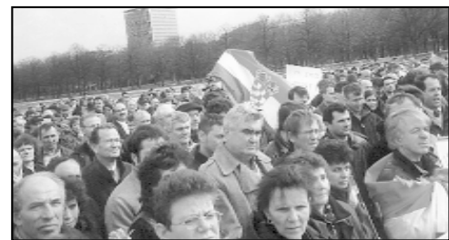
Okupljeni Hrvati pristigli su iz mnogih zapadnoeuropskih zemalja

U organizaciji Hrvatskog svjetskog kongresa iz Njemačke i Hrvatske kulturne zajednice iz Amsterdama u subotu 18. ožujka u Den Haagu je održan prosvjed protiv odluke Haaškog suda o teškoj presudi generalu Thomiru Blaškiću. Više od 3.000 Hrvata na miran je način iskazalo svoje nezadovoljstvo te iznijelo i svoje stavove vezane za taj slučaj, a delegacija predvođena predsjednikom HSK Njemačke predala je predstavnicima Haaškog tribunala i peticiji sa zahtjevima.