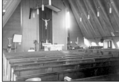
Unutrašnjost crkve u kojoj se služi misa za Hrvate

sta krhkog zdravlja, ali ipak vitalan dočekao nas je u svom stanu nedaleko od samog kluba. Ponudena nam je neotvorena boca Badelovog pelinkovca, makar sam don Anti obavio da je trenutno štrajk u 'Badelu' i da ne znam kada će dobiti slijedeću bocu, jer ga nema ni u Zagrebu. Ne mareći za pelinkovac, dao mi je do znanja da ga najviše zanima što se trenutno događa u domovini. Iznoseci mu svoje vlastito viđenje trenutne situacije u zemlji, shvatio sam da je ono što je meni nezanimljivo i monotono, njemu prilično interesantno. Izostanak dnevnih novina i neredovito praćenje radio vijesti, učinilo mu je svako moje izvješće svježim novinom. A kada sam ga upitao da mi kaže ponešto o Hrvatima u svojoj crkvi, razgovor se sveo na kratka objašnjenja