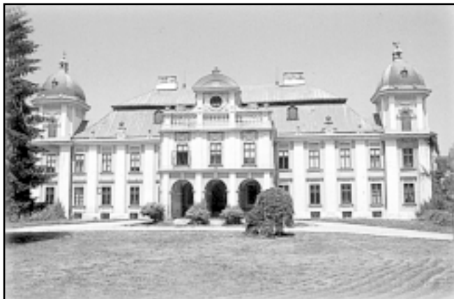
Ispred dvorca Pejačević organizirat će se koncert

Festival će se održati prema već utvrđenom rasporedu, te je tako za subotu, 10. lipnja prije-