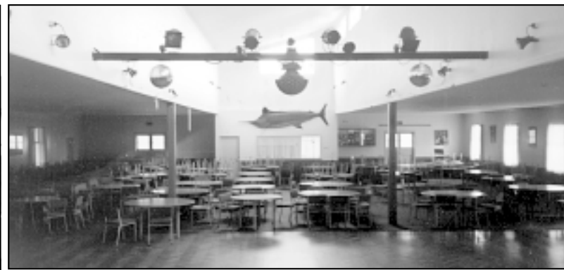
Unutrašnjost Kluba koji može primiti četrstotinjak posjetitelja

U POSJETU HRVATIMA U TESLIČKOJ ŽUPI SV. JOSIPA