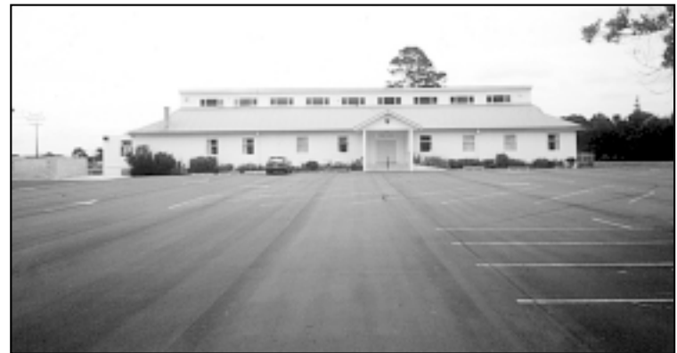
Hrvatski centar u Aucklandu kojeg je otvorio pokojni predsjednik Tuđman

Svi članovi Hrvatskog kluba osjećaju privrženost ovom mjestu jer ipak je tu potrošeno puno živaca, odricanja i ulaganja da bi se došlo do svega. Želja djelatnika Kluba je da uz same Hrvate što češće dolaze i njihovi prijatelji koji nemaju veze s Hrvatskom, da bi bolje upoznali naše ljude