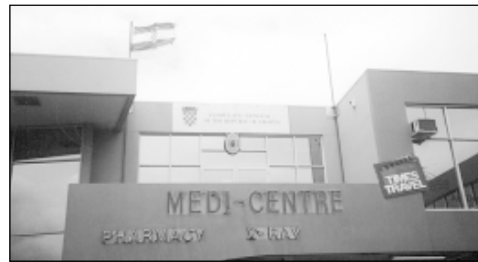
Zgrada Hrvatskog konzulata u Aucklandu