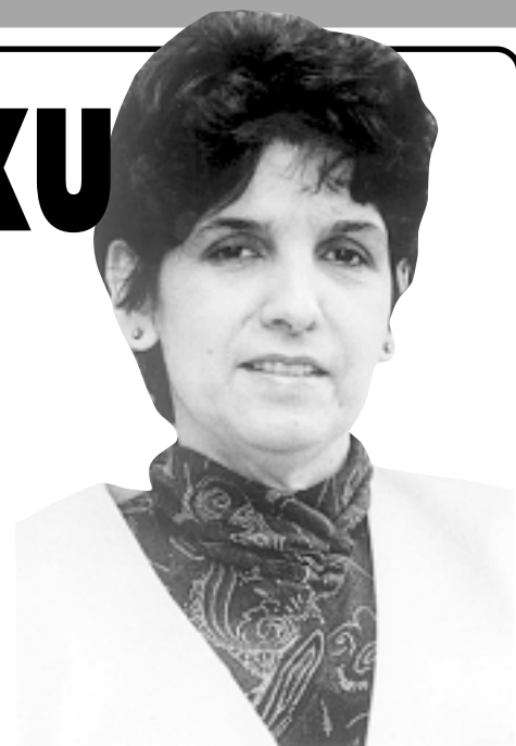
Hrvatsko američka zajednica je na izdisaju

-Da, kod kuće i vani. Postoji silno zajedništvo Talijana, Iraca, koji su se doseljavali generacijama. Zašto ne i nasi? Kakav li je samo irski lobi! Trebali bi oskolititi hrvatsko-