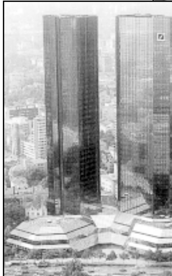
U europskom financijskom središtu, Frankfurtu, pokazano je veliko zanimanje za promjene u Hrvatskoj