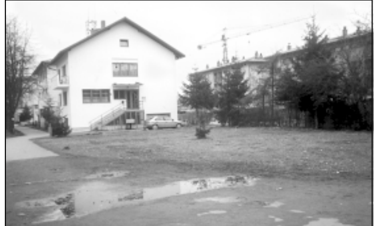
Mjesto na kojem je bila crkva sada je livada

»Nedostaje nam crkva; misu držimo u podrumskoj prostoriji župne kuće. Za crkvene blagdane natiskalo bi se i do 250 vjernika. Nedjeljom na misi bude između 120 i 140 vjernika. Ove godine na Sv. Josipa bilo je oko 300 ljudi!«, ističe don Juro Šantor