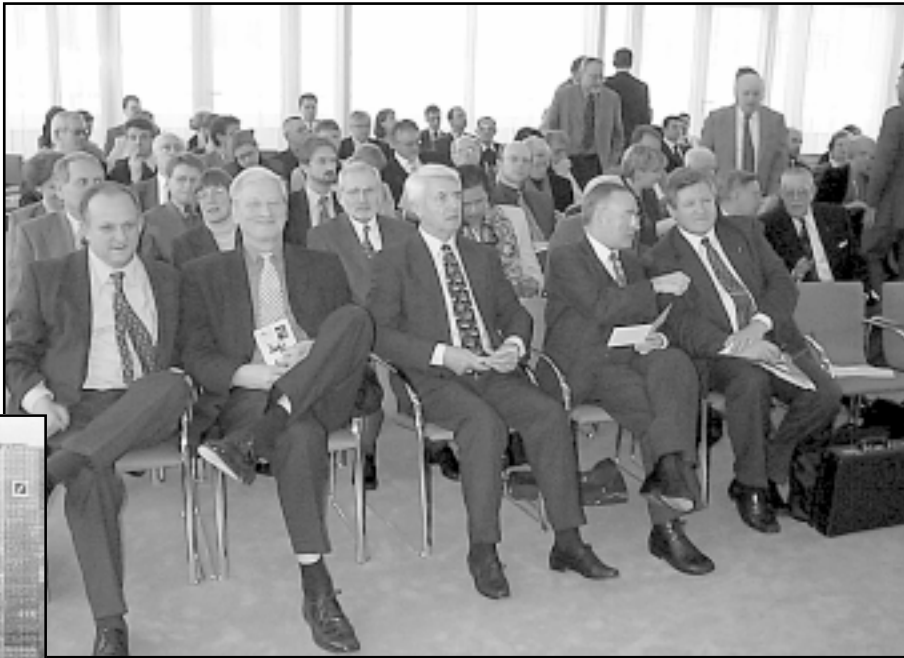
Tribina je okupila dio političke i financijske elite u Frankfurtu

KAKVE SU PORUKE S TRIBINE »PRO- GRAM NOVE HRVATSKE VLADE I UKLJUČIVANJE HRVATSKE U EUROPSKOATLAN- TSKE INTEGRACIJE« ORGANIZIRANE U PROSTORIMA »FRANKFURTER ALLGEMEINE ZEITUNGA«