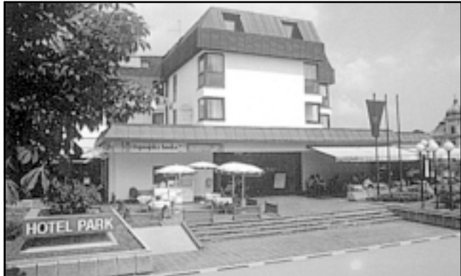
Hotel Park ugostit će brojne goste iz domovine i iseljeničtva