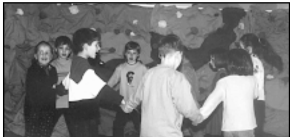
Najmlađi su uvijek spremni za ples

»Djetinjstvo se katkad vraća« bila je tema Susreta. Učenički su izveli igrokaze, recitacije pjesama poznatih hrvatskih pjesnika i svoje