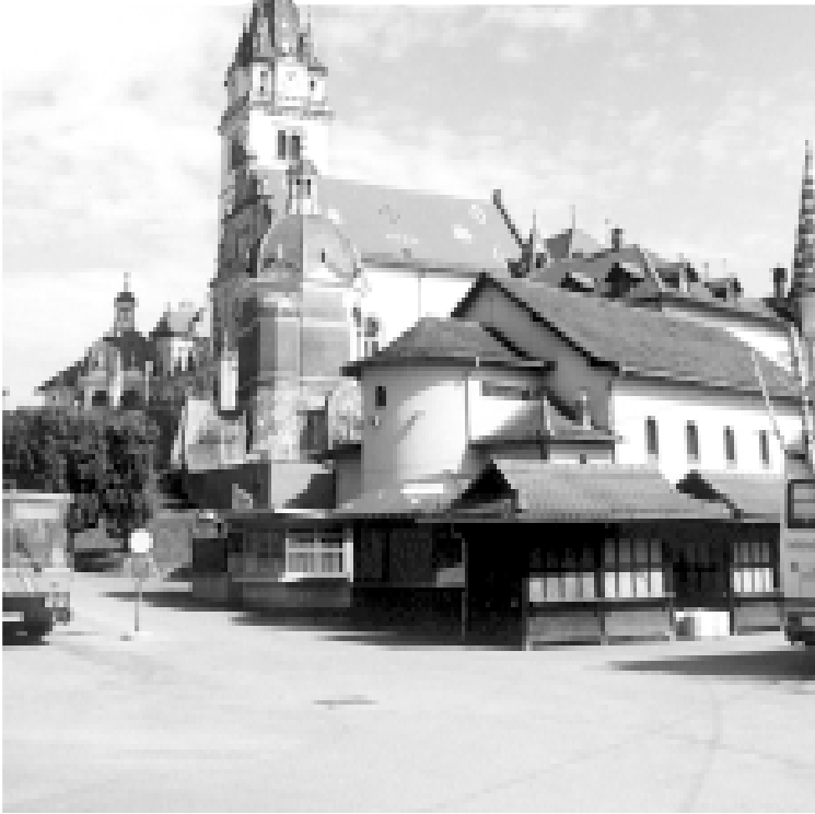
Župna crkva i svetište Majke Božje Bistričke

Molitva za mir U vrijeme ratne agresije na Hrvatsku u Mariju Bisticu hodočastili su mnogi vjernici koji nisu mogli doći do svojih svetišta. Molili su se da se što prije vrata na svoja ognjišta. S njima je više puta bio i kardinal Franjo Kuharić. Poznate su njegove riječi i riječi blaženika Alojzija Stepinca da su svetišta Majke Božje - liječilišta svake duše».