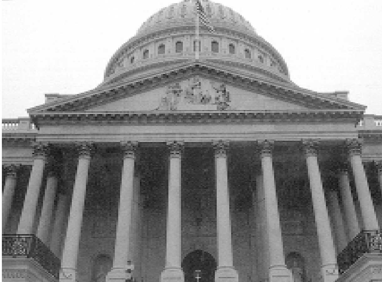
Središnja točka u svemiru američkog sustava javnih knjižnica nalazi se preko puta Capitola

KAKAV ĆE STAV PREMA HRVATSKOM JEZIKU ZAUZETI JEDNA OD NAJUTJECAJNIJIH I NAJVEĆIH KNJIŽNICA DANAŠNJIJE - LIBRARY OF CONGRESS, KONGRESNA KNJIŽNICA U SAD-U?