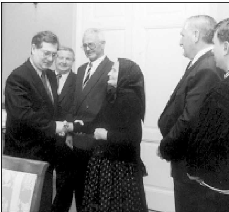
Predsjednik Sabora Tomčić u srdačnom susretu sa »svojim Srijemcima«

U razgovoru s predsjednikom Sabora potaknuli su i pitanja viznog režima, kao i pitanje priznavanja radnog staža ste-