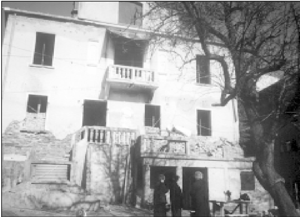
Župna kuća izvana izgleda oronulo i devastirano

zasada, nestvarna. Valjda je to jasno i ljudima iz politike koji u svećenicima derventskoga kraja vide sigurne suradnike u povratku. U tom smislu treba gledati i nedavni posjet člana Predsjedništva BiH predsjednika HDZ BiH Ante Jelavića sa suradnicima u derventskoj župi. Nakon što je razgledao kriptu crkve i upoznao se s tijekom obnove župne kuće Jelavić je obećao nastavak potpore. Do sada, Jelavićev je ured darovao 100.000 DEM za odvoženje ruševina župne crkve dok je za obnovu žup-