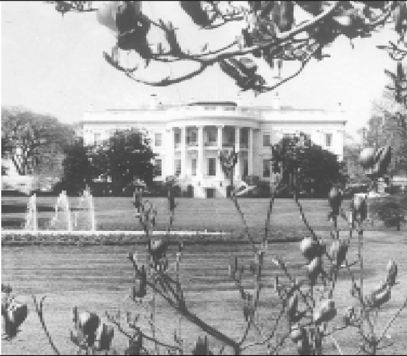
Pritisak treba vršiti svugdje u Americi, pa tako i pri samom političkom vrhu

svijeta na kojima se napaja i Kongres i Administracija. Kroz Kongresnu biblioteku treba se vidjeti da Hrvati imaju svoj jezik i svoju kulturu.