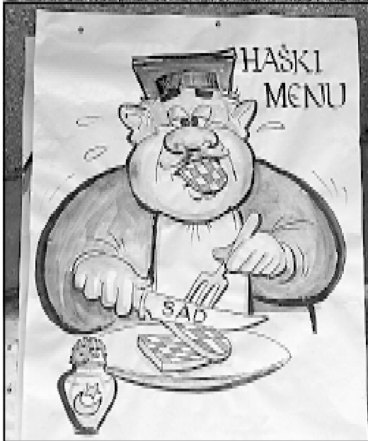
Plakat snimljen u BiH nakon presude Blaškiću

atra oko njega, bila smiješna kad ne bismo znali da se ovdje svako malo optužnice prema potrebama i naredbama odozgo mijenjaju i preinačuju. I što je najgore: još uvijek bezazlena optužnica na Međunarodnom sudu u Den Haagu ne daje nikakvu garanciju da netko zbog nje takve neće biti smrtno osuđen.