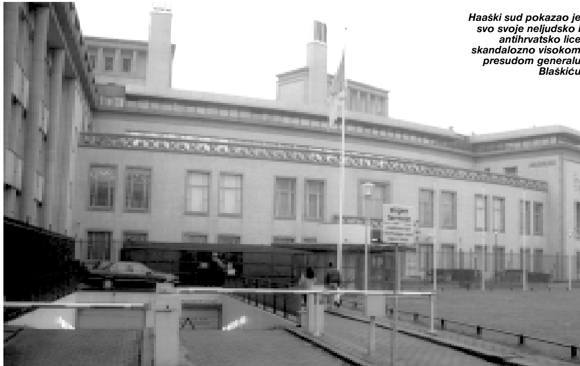
Haaški sud pokazao je svo svoje neljudsko i antihrvatsko lice skandalozno visokom presudom generalu Blaškiću