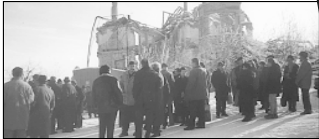
Ruševine bivšeg samostana

ru, osim inicijativne donacije koja je stigla iz ureda Ante Jelavića. No, led je probijen, tvrdi on. Najavljuje kako bi suradnja sa CIMIC-om, jedinicom za civilno-vojne odnose SFOR-a, mogla rezultirati obnovom električne mreže, jednoga dijela prometne mreže i određenog broja obiteljskih kuća. Djelatnici CIMIC-a najprije traže konkretna imena ljudi koji su se vratili i imena onih koji su zainteresirani za povratak. I dok predstavnici međunarodne zajednice insistiraju na tome da prognanici budu na terenu i tako pokažu želju za povratkom, povratnici gube strpljenje u iščekivanju pot-