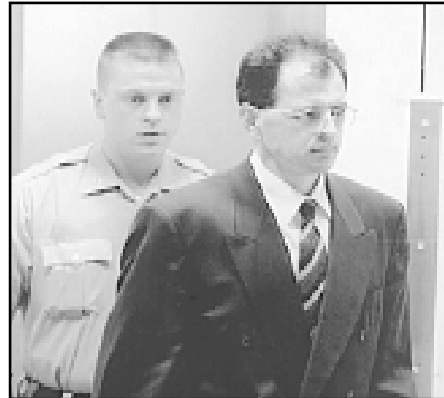
General Blaškić postaje sve više hrvatskim simbolom otpora onim međunarodnim krugovima koji žele nehrvatsku Hrvatsku