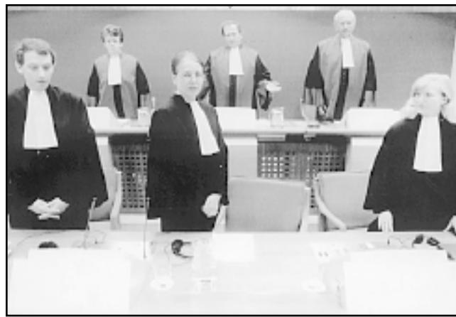
Deset puta reci laž, jedanaesti put je ona istina ili deset puta osudi Hrvate, jedanaesti put su oni krivi kao Srbi

Što se samog Suda tiče, on se ravna prema pravilima koja su tako neprecizna i općenita da ostavljaju veliki prostor samovolji njegovih dužnosnika. Izravno se ogrješio o konvencije o ljudskim pravima po tome što ima bezgranično vrijeme pritvora osumnjičenika, osumnjičeni su primorani dokazivati svoju nevinost umjesto da Sud dokazuje njihovu krivnju, te što izbjegava utvrditi tko snosi odgovornost i odštetu za nevino optužene i oklevetane diljem svijeta. Uz to, za pogreške u suđenju nikomu se ne odgovara, jer nije predviđena više pravosudna instanca koja bi ovaj Sud nadzirala. Neravnopravnost obrane nasuprot optužbe pred Sudom, kršenja prava optuženika, podnošenje nejasnih optužbi i njihove višekratne naknadne izmjene, već prema potreba tužitelja, također se neće jednom moći zaobići.