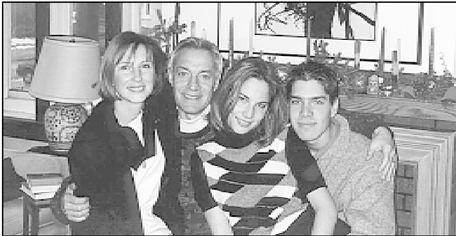
U obiteljskom domu

Haaški sud je toliko profesionalan i kompetentan da podiže optužnice bez temeljne provjere i temeljem montiranih podataka muslimanskih tajnih služba. Tako je godinama pozivao na sud mrtvog čovjeka, a za veći broj Hrvata koje su najprije razvikali kao notorne ratne zločince, nije imao nikakvih dokaza, pa ih je morao vratiti natrag kući. Također je tužiteljstvo Suda dovodilo i lažne svjedoke, neki od njih su bili dužnosnici međunarodne zajednice, a neke optuženike je uz prijatne nagovarao »na suradnju«, tj. da lažu protiv svojih sunarodnjaka. A u koju vrstu profesionalnosti treba staviti slučaj Zlatka Aleksovskog, bez obzira na pravne mogućnosti? Njega je jedan sudac Suda osudio na tri godine i nakon izdržane kazne pustio kući, a onda drugi sudac - za potpuno ista djela - osudio na sedam godina! Važno da se nešto događa i da vrijeme prolazi.