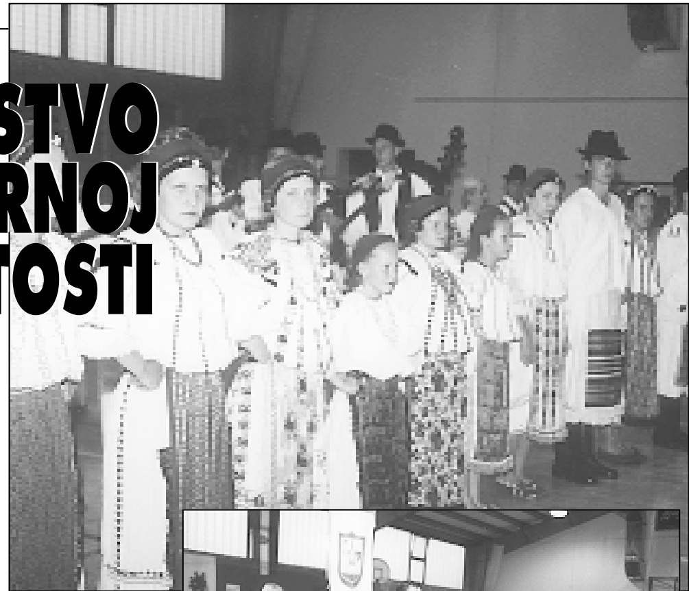
KUD »Dona« iz Kašima u Mađarskoj

sveta misa za goste i domaćine trećeg po redu »Rešetaračkog pletera«. Bila je ovo prigoda za veselo druženje, pjesmu, ples i razgovor Hrvata iz Rešetara s Hrvatima koji žive daleko izvan domovine, brižno čuvajući materinji jezik od zaborava. Željka Lešić