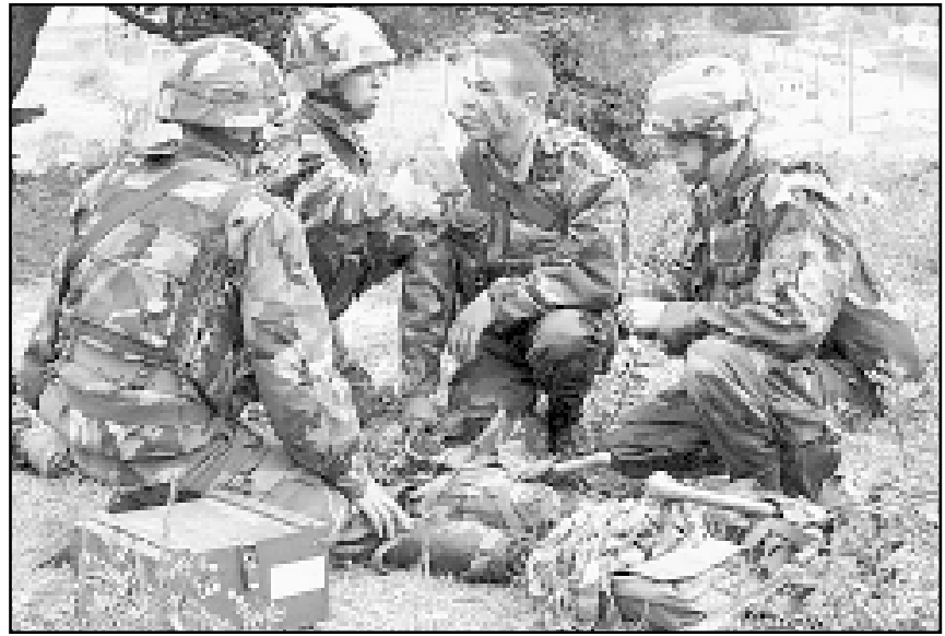
Hrvati svoju komponentu u vojsci FBiH smatraju superiornom i u tehničkom i u profesionalnom smislu

JE LI PREKID PROGRAMA SJEDINJENIH DRŽAVA »OPREMI I UVJEŽBAJ« ZA HRVATSKU KOMponentu VOJSKE FBiH DOKAZ DA JE ON BIO NEREALAN