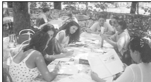
U listu »Spomenar«, koji uređuju i ilustriraju polaznici, između ostalog se bilježe svi događaji tijekom Škole

U SUSRET SREDIŠNJOJ PROSLAVI DANA DRŽAVNOSTI REPUBLIKE HRVATSKE U ŠVICARSKOJ: